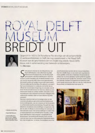
Tableau Fine Arts sept 2022