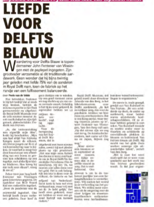
Telegraaf 7 november 2022