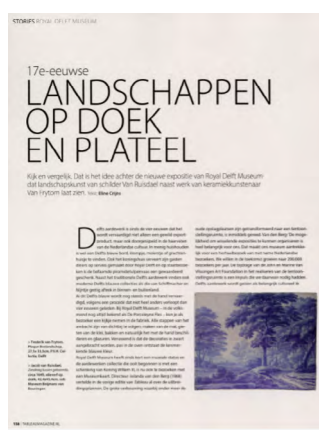
Tableau Fine Arts nov 2022